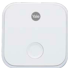
Wi-Fi Bridge Yale Connect