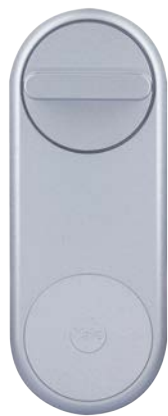
Chytrý zámek Yale Linus® Smart Lock

Sdílejte přístup do svého domova s důvěryhodnými přáteli a rodinou, aby byli doma vítáni stejně srdečně jako vy. Vytvořte si vlastní scény, ve kterých se světla Philips Hue rozsvítí nebo zhasnou podle toho, kdy je zámek Yale odemčen nebo uzamčen vámi či vybranými hosty.