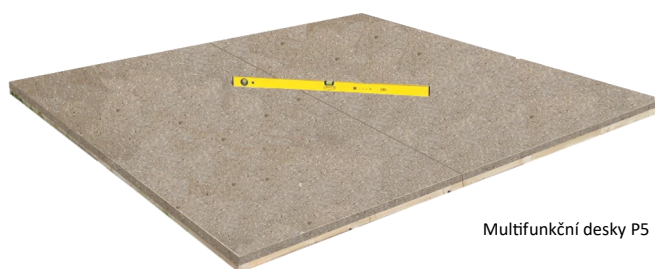
Multifunkční desky P5

Podlahové prvky* ošetřete zespoda, složte, otočte a vyrovnejte pomocí vodováhy.