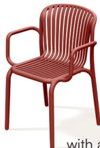
chair with armrests FBRK658