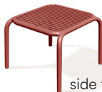
side table FBR554