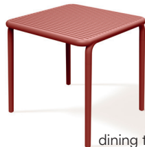
dining table FBR5888