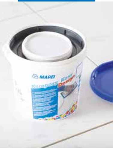
Dvousložková spárovací malta dodávána ve vědru obsahujícím složku A i složku B