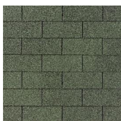
05 – Klasická zelená