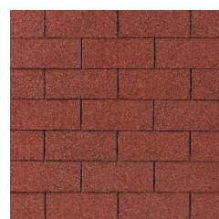
10 – Cihlově červená