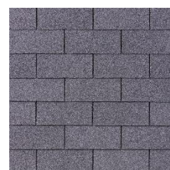
31 – Šedá břidlice