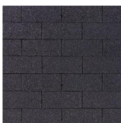
01 – Černá