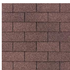
07 – Podvojná hnědá